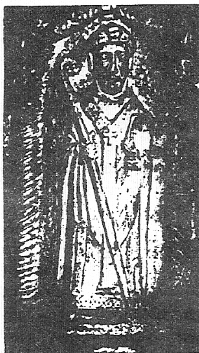
Obrázek 3: Nejstarší podoba sv. Vojtěcha

Po návratu z Magdeburku se Vojtěch projevoval jako každý jiný mladík, jak o tom píše jeho přítel Bruno z Querfurtu. Krásný a veselý mladík Vojtěch působil velmi příznivě na své okolí a lidé byli přesvědčeni, že se stane příjemným a světsky smýšlejícím církevním knížetem.