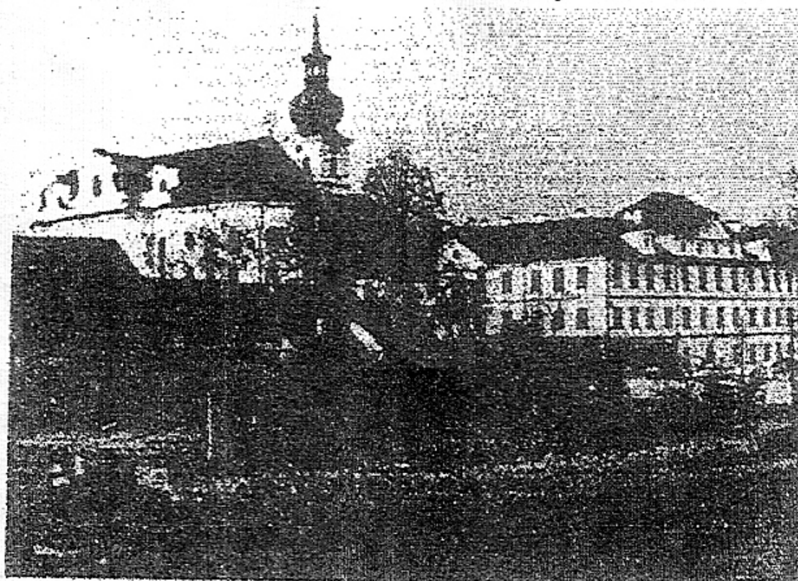
Obrázek 5: Benediktinský klášter v Břevnově

Před branami Prahy zakoupil Vojtěch rozsáhlý les Šárku. Na vymýceném prostoru položil základy ke klášteru u něhož postavil chrám zasvěcený Panně Marii a sv. Benediktu. Zde tedy vyrostl mohutný proud benediktinských řeholníků, kteří byli nositeli kultury nejen v naší vlasti, ale i v sousedních zemích. Toto území je dnešní břevnovský klášter, za totality naprosto zdevastovaný.