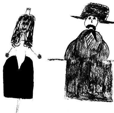
namalovala Kristinka Plevová

Potom byl oběd a po obědě byl odpolední klid. Po klidu jsme měly 1. odpolední program a to byla VYBÍJENÁ. Ta se hraje tak, že musíš vzít míč do rukou a musíš tím míčem někoho trefit, a tak ho vybijješ.