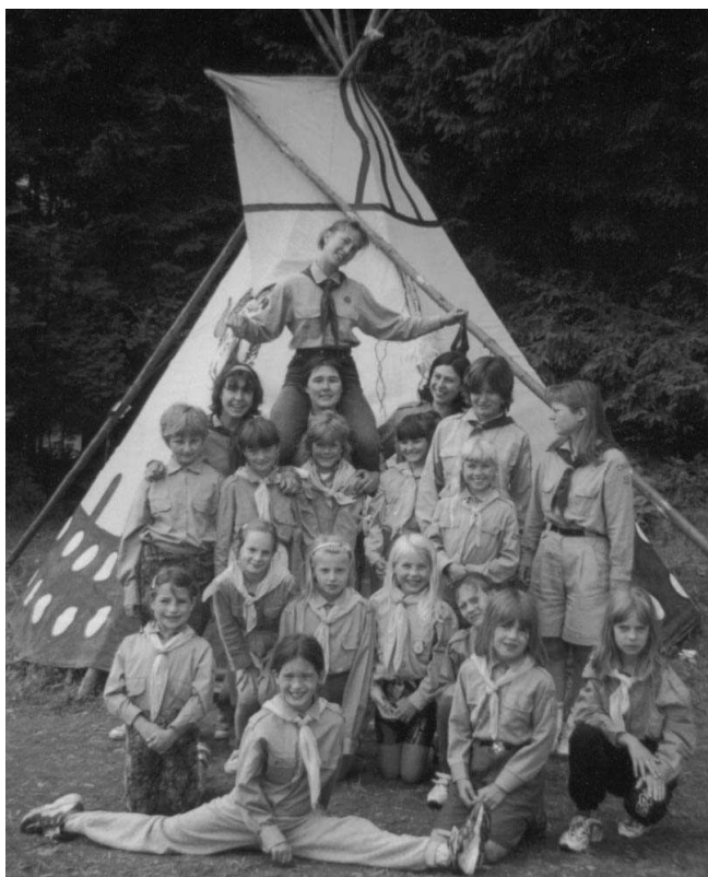
Na nové kamarádky se těší světlušky a jejich vedení.

Dívčí skautský oddíl Severky zve mezi sebe na tábor na doplnění počtu světlušek děvčata 7-10 let z farnosti sv. Tomáše. Tábor světlušek se uskuteční od 14. do 23. července v Jeníkově u Hlinska (Hlinsko v Čechách). Bydlet budeme v malém domku na kraji vesnice, hned vedle lesa, v pěkném prostředí Vysočiny. Kromě toho, že hrajeme spousty her, poznáváme něco nového o přírodě, chodíme na výlety, zpíváme nejen u táboráku, hrajeme divadlo... provází nás celým naším táborem dobrodružná a napínavá etapová hra! Cena tábora je 1100 Kč.