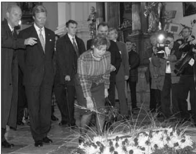
Foto z návštěvy velkovévody lucemburského s chotí