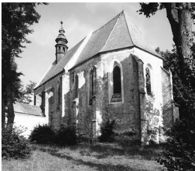
autor: Martin Bílek