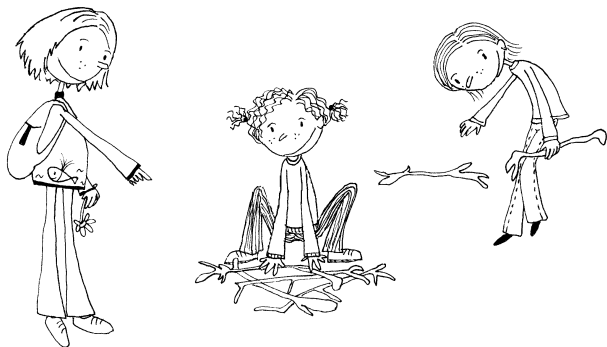
Gábina Hrrrrrrrrr Migotová

Nakonec jsme dorazily na zastávku a jely domů. Tato akce s Rezekvítkem byla FF (fakticky fajnová).