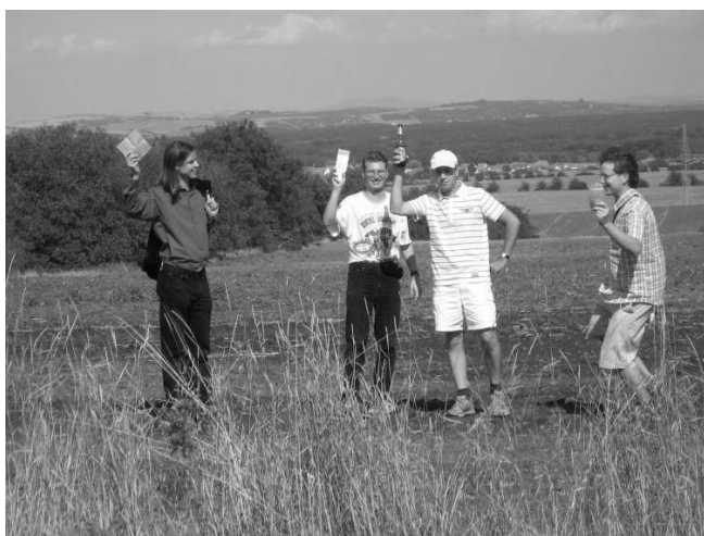
Obr. č. 2: Členové výpravy hlasují o archeologickém významu lokality Náklo

Následovala návštěva archeoskanzenu v Modré, kde vznikla nejen replika velkomoravského kostela, ale celá velkomoravská vesnice s rekonstrukcemi jednotlivých obydlí, od malé zemnice po kamenné sídlo velmože. Archeoskanzen dává jasnou představu o dosti tvrdém životě starých Slovanů.