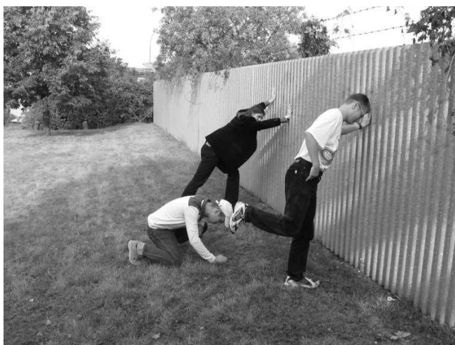
Obr. č. 1: Členové Moravského kulturního spolku zahajují druhou etapu vykopávek v lokalitě Špitálky

Příznivé klima letního období a uvolněná pracovní morálka v čase dovolených svádí k cestám za poznáním. Proto se několik členů Moravského kulturního spolku rozhodlo využít víkendu na sklonku léta a vyrazit za poznáním do kraje slovanských věrozvěstů Cyrila a Metoděje a seznámit se blíže s reáliemi a památkami na dobu, v níž působili.