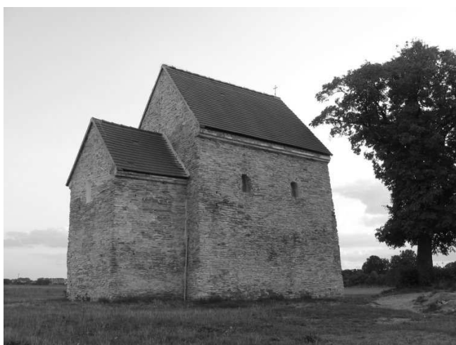
Obr. č. 3: Kostel sv. Margity Antiochijské

klíčové dírky, skalpely či okovy – mají svůj ustálený tvar po více jak tisíciletí.