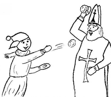
Sv. Mikuláš se kouluje s kostelníkem.