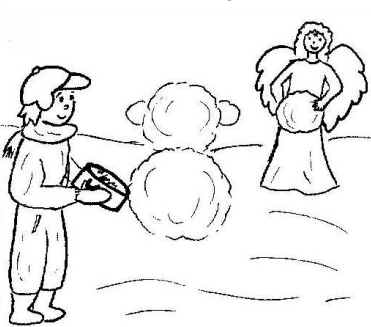
Pan kaplan s andělem staví pana faráře.