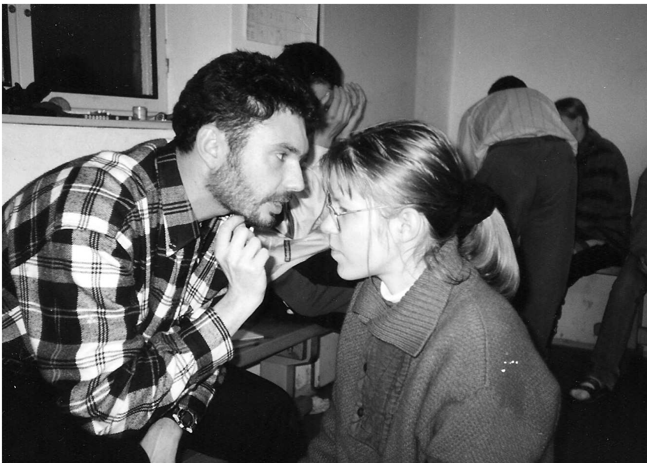
Silvestr 1999 v Bílých Karpatech organizovaný společenstvem mládeže od sv. Tomáše