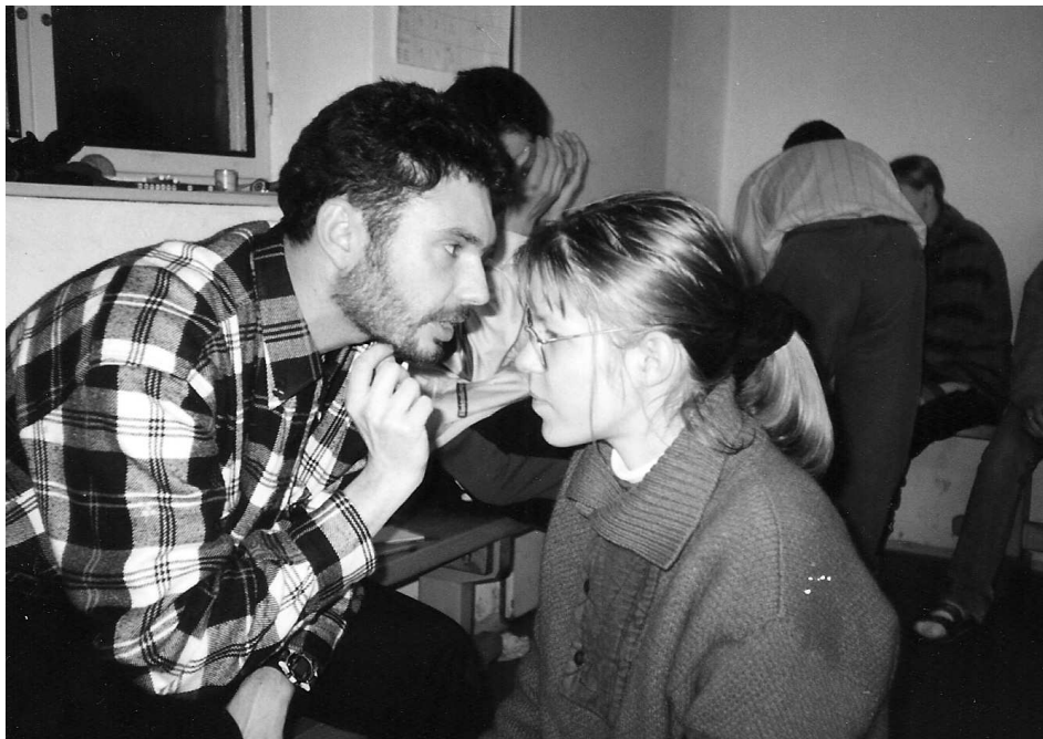
Silvestr 1999 v Bílých Karpatech organizovaný společenstvím mládeže od sv. Tomáše