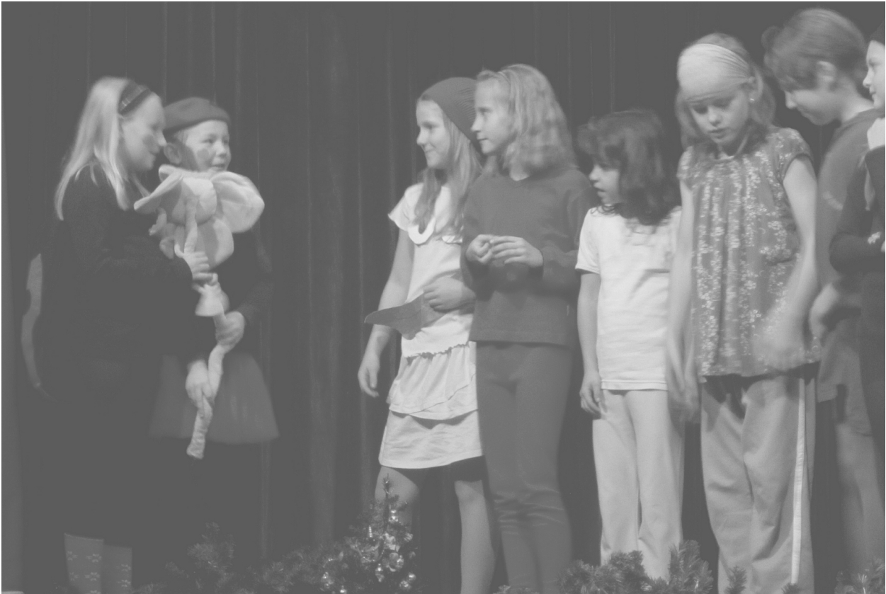
Na Petrinu bylo na Mikuláše veselo