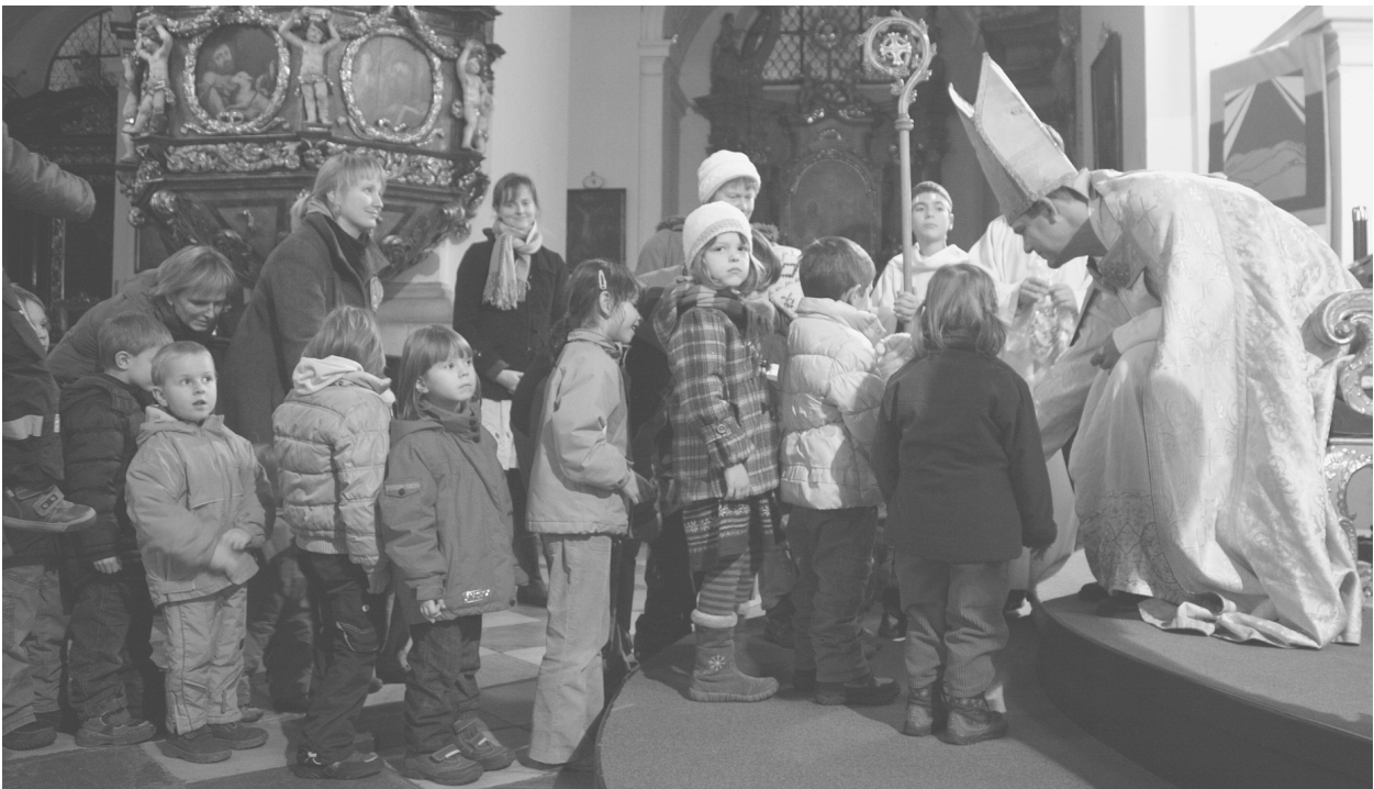
Za nejmenšími dětmi přišel Mikuláš do kostela