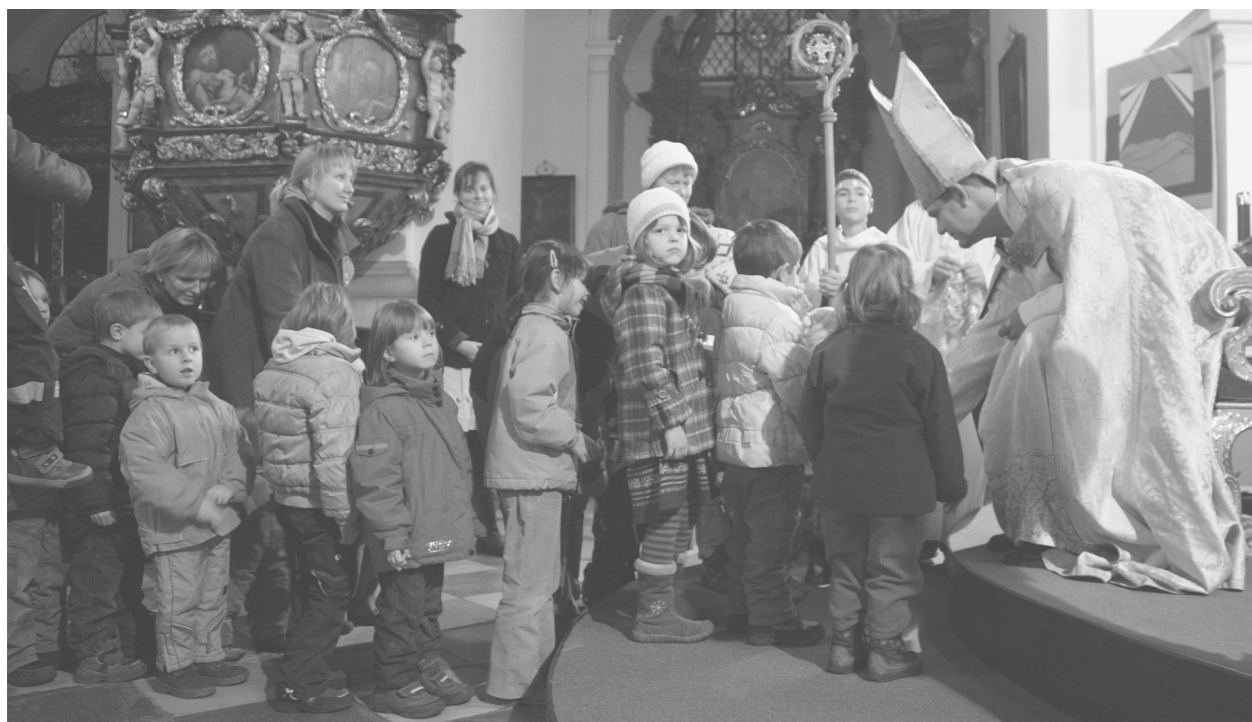
Za nejmenšími dětmi přišel Mikuláš do kostela