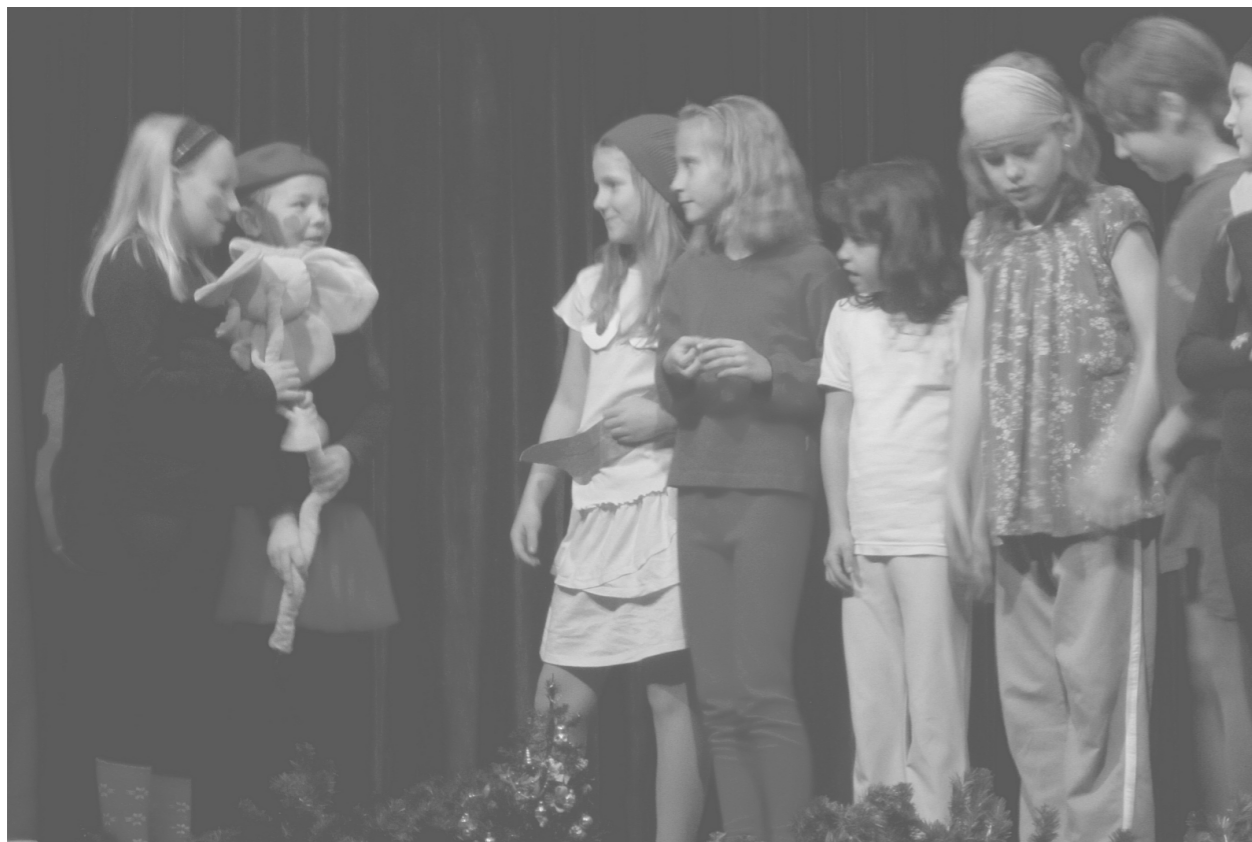
Na Petrinu bylo na Mikuláše veselo