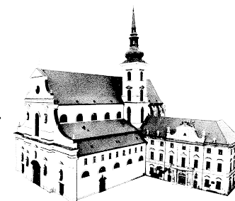
ZPRAVODAJ FARNOSTI PŘI KOSTELE sv. TOMÁŠE V BRNĚ