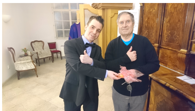
Jeden z výherců v tombole.